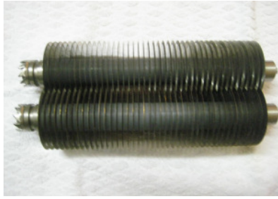
SET aus zwei Schneideinsätzen