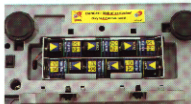
Akku-Betrieb (Hersteller beispielhaft)